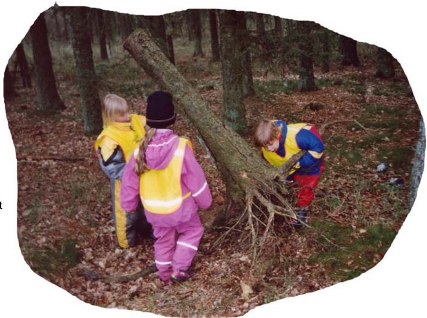
En pragtfuld legeplads.

Vi spiser suppe med tomater Her var engang soldater Nu går vi hjem fra skoven her For vi kan ikke rime mer.