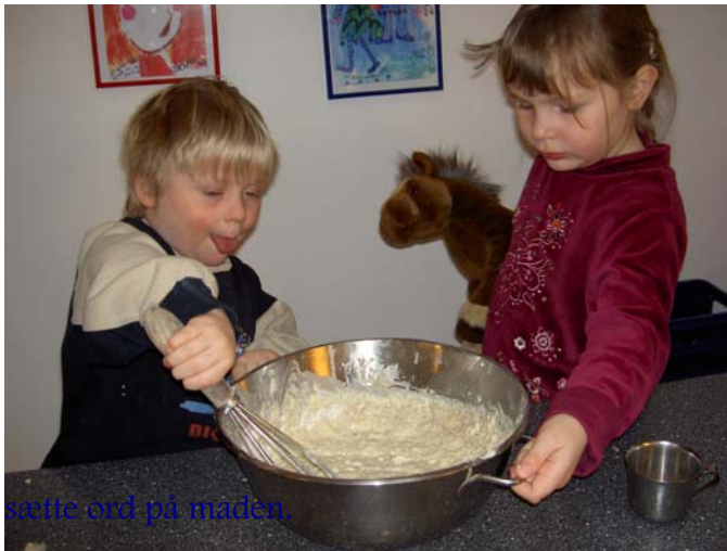
sætte ord på maden.

Der er en masse sanser der kommer i brug når hænderne skal ælte dej og det nybagte brød dufter over hele børnehaven.